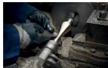
Mechanization of an ornamental element from Lorraine collection.

To continue learning this noble craft and to enhance its value with the help of architects and lighting designers, is the next