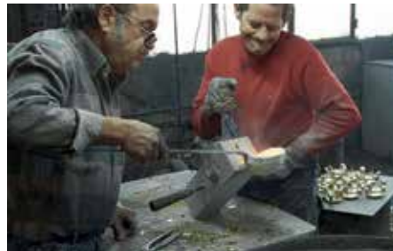
Trabajo de fundición a partir de un lingote de latón.

Entre algunos de los proyectos más emblemáticos en los que hemos trabajado, destaca la colaboración con el Hotel Burj AlArab, en Dubai, considerado el hotel más lujoso del mundo, pero también fantásticos rincones de pequeños hoteles y